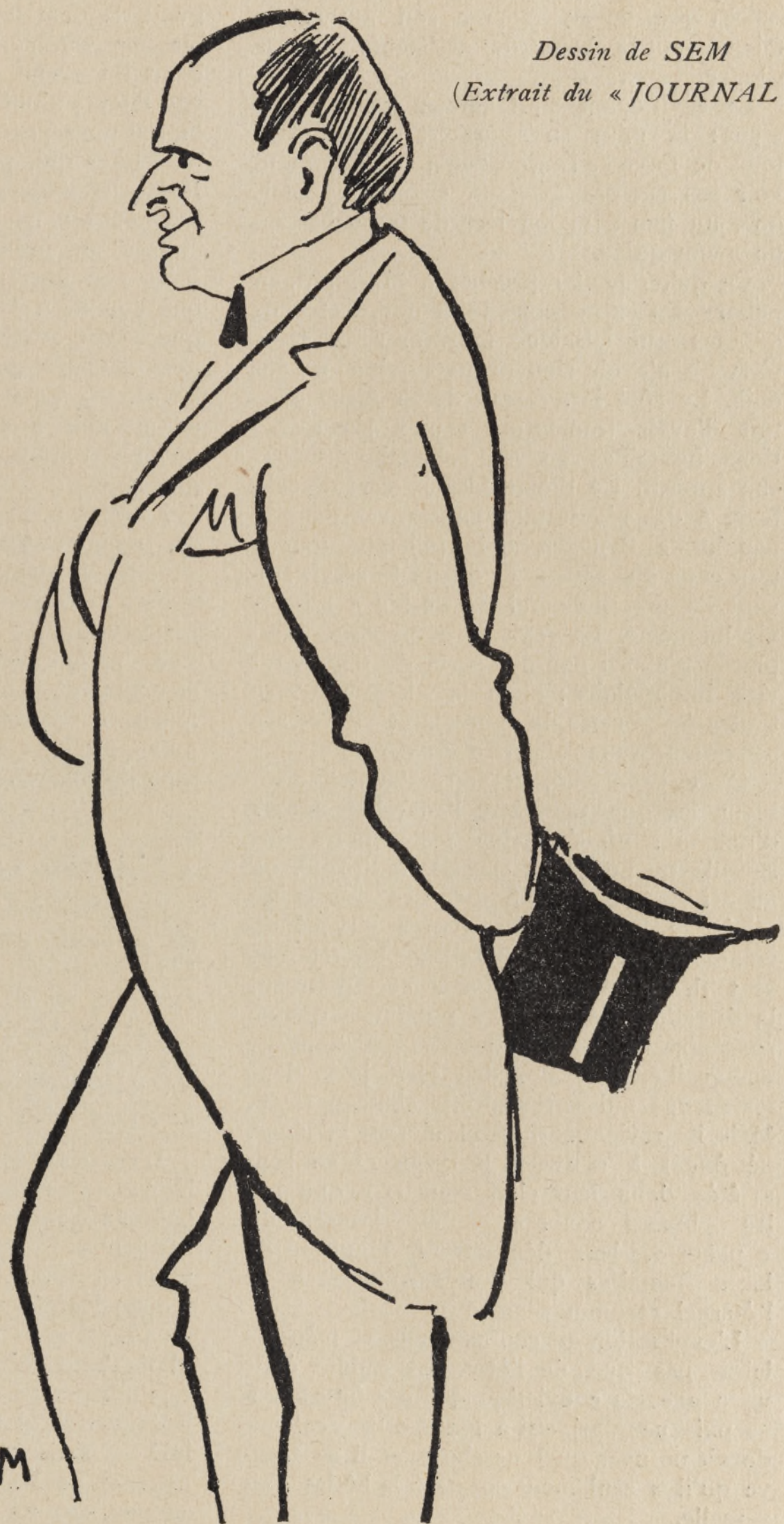
M. Lugné-Poe (Directeur du Théâtre de l'Œuvre)