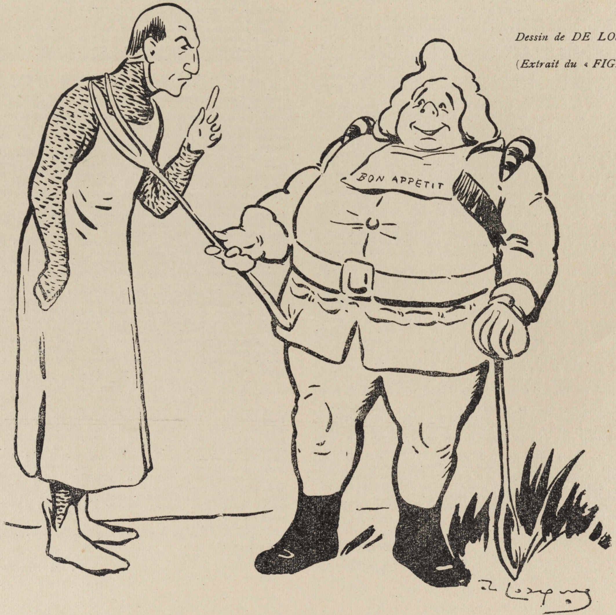
M. Lugué-Poe ( Anguille )